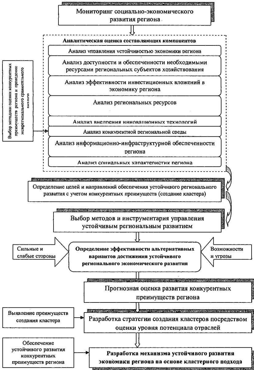
Рис. 2 — Алгоритм реализации кластерного подхода к обеспечению устойчивого регионального развития (Авторская разработка)